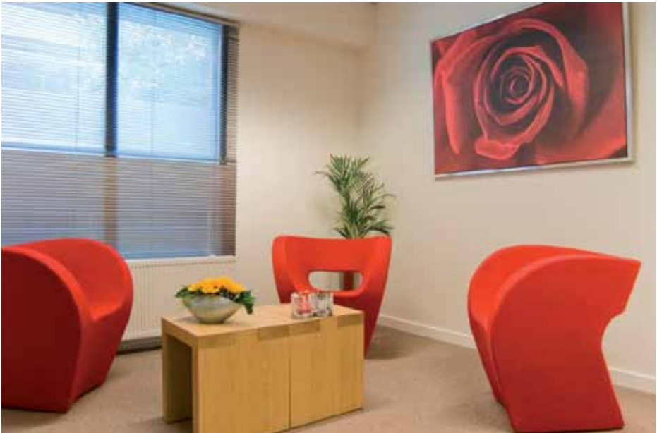
kamer maatschappelijk werk Verbeeten Tilburg