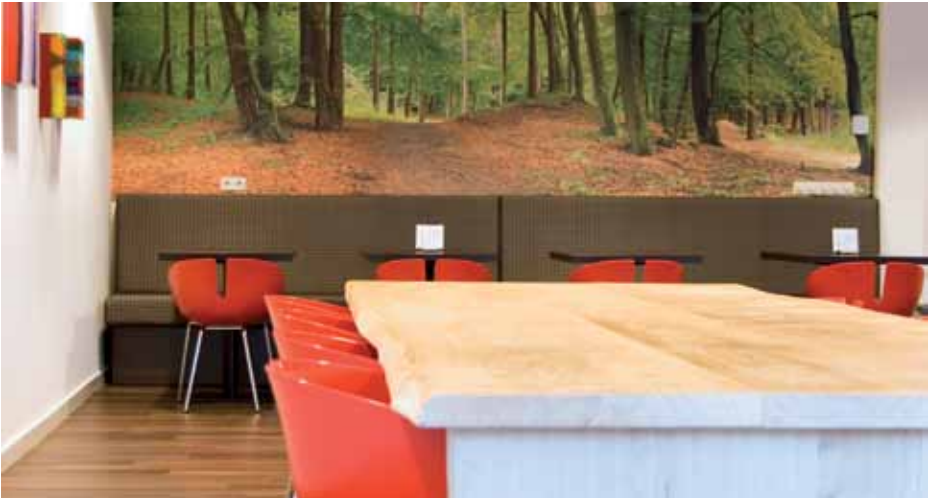
bezoekersrestaurant Bon Appetit Verbeeten Tilburg

In Verbeeten Den Bosch vindt u een koffieautomaat in de centrale hal.