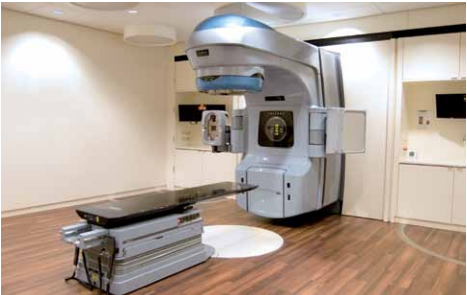
bestralingstoestel Fluoriet Verbeeten Tilburg