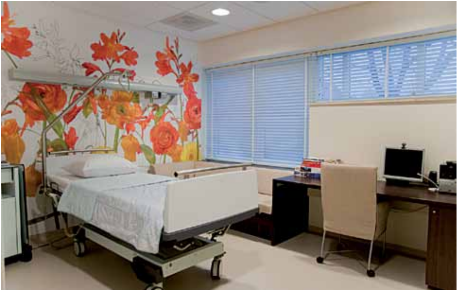
kamer op de afdeling brachytherapie Verbeeten Tilburg

De radiotherapeut-oncoloog bespreekt met u of en wanneer controle nodig is. Een definitieve afspraak krijgt u enkele weken van tevoren toegestuurd.