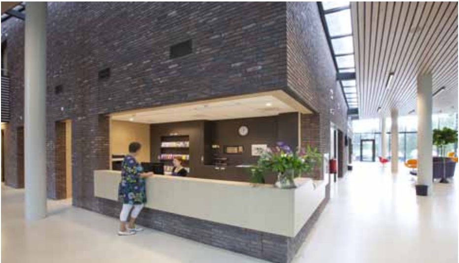
Verbeeten Den Bosch